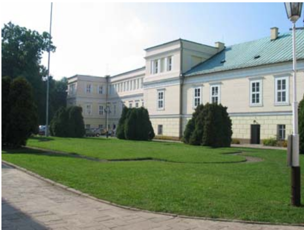
Zespół pałacowy w Koszęcinie.