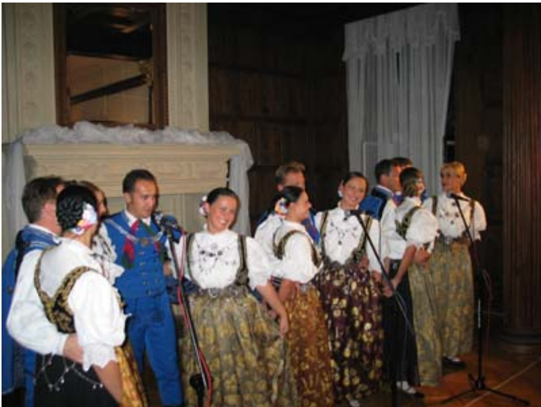
Występ części artystów Zespołu „Śląsk”.