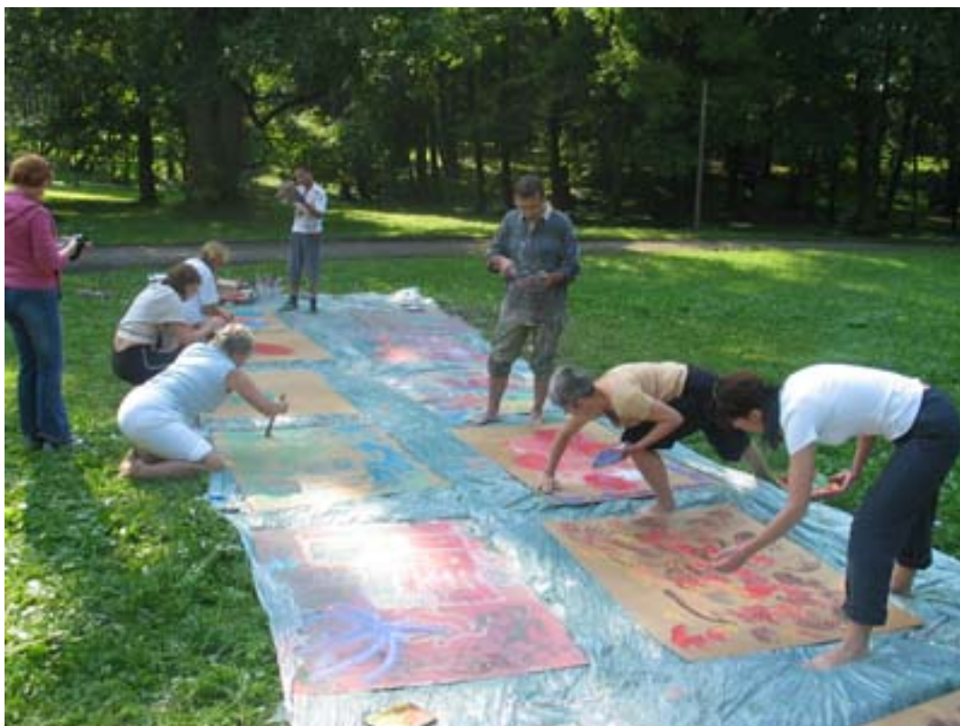
Efekty pracy uczestników warsztatu.