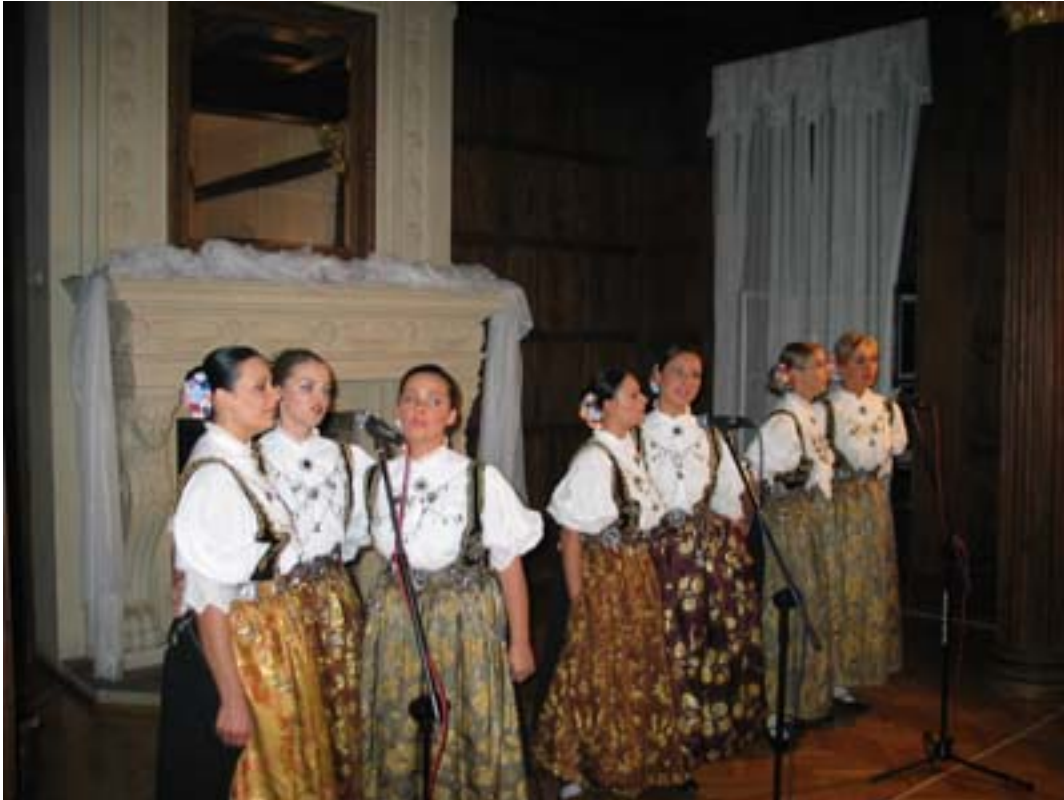
Występ części artystów Zespołu „Śląsk”.