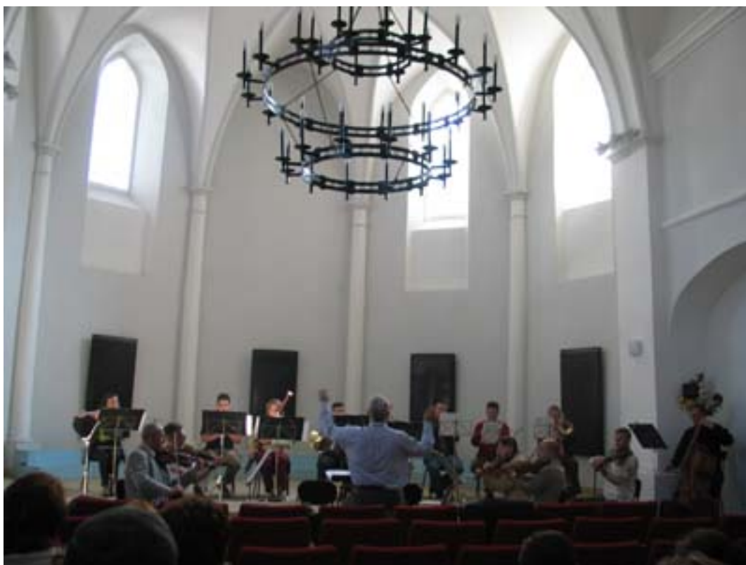
Próba orkiestry Zespołu „Śląsk”.